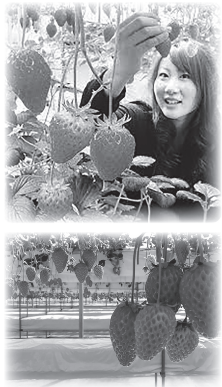
いちご狩り (名張市青蓮寺)